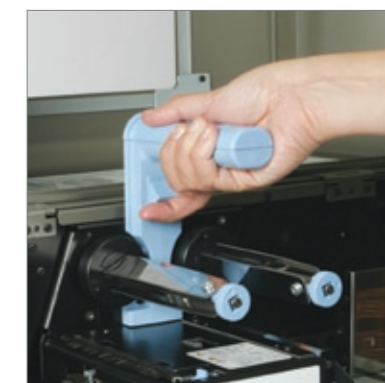
Fácil acceso interno al levantarse verticalmente el bloque de impresión