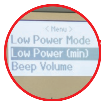
Pantalla con gran cantidad de información para el usuario