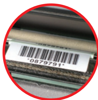
El sorprendente modelo que integra el módulo de despegado, es capaz de despegar etiquetas de tan sólo 10mm de avance