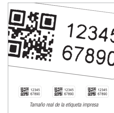
La más alta resolución a 600 x 1200 dpi, gracias al sistema de control de motor de micro-pasos